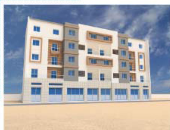
Façade postérieure (commerciale en RDC)