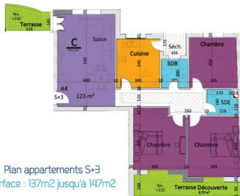
Plan appartements S+3 Surface : 137m² jusqu'à 147m²